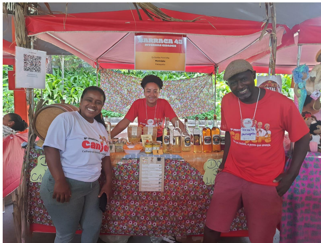
5º Festival Canjerê - Participação de Pontinha de Sabor no festival. Acesso disponível em: https://portalbelohorizonte.com.br/eventos/festival/cultura-popular/5o-festival-canjere