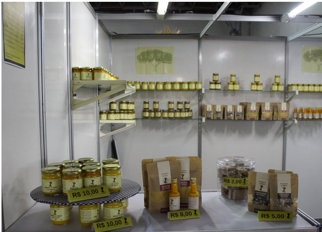
Pontinha de Sabor participa da AgriMinas 2019, um passo muito importante para a marca.