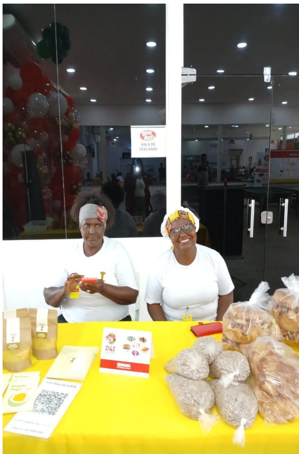
Participação da Pontinha na feira Bombril (2025)