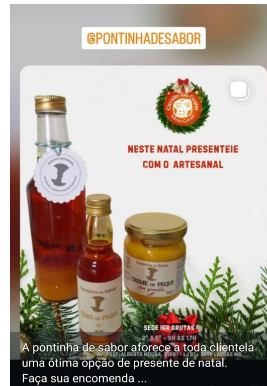
Pontinha de Sabor divulgando seus produtos através do Instagram, gerido autonomamente pelas trabalhadoras